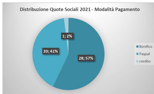
Distribuzione per tipologia e modalità di pagamento delle quote sociali SILS ricevute nel 2021.

Le entrate patrimoniali ammontano a 6,30 € da interessi attivi C/C Unicredit.